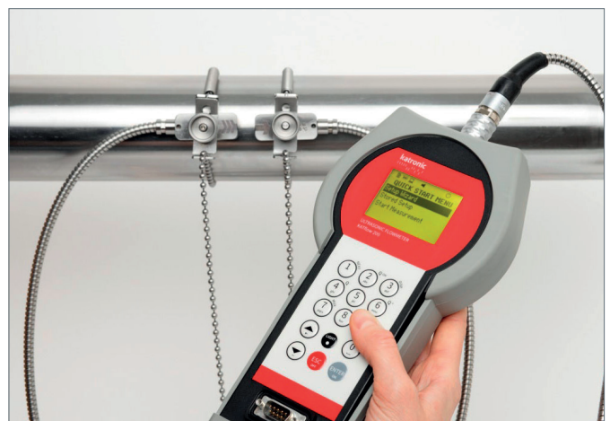
KATflow in werking